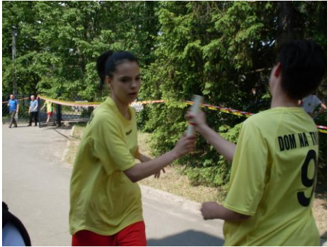
nasze dzielne dziewczyny